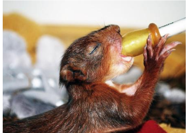
FOTO 2: HET EEKHOORNJONG KRIJGT SPECIALE EEKHOORNMELK.

Een jonge eekhoorn op de grond is meestal wél een slecht teken (foto 2). Hun bolvormig nest bevindt zich vaak hoog in een boom. Meestal is dan ook het nest vernietigd door een storm of gekapte boom. Breng in dat geval de eekhoorn in een kartonnen doos naar een vogelopvangcentrum.