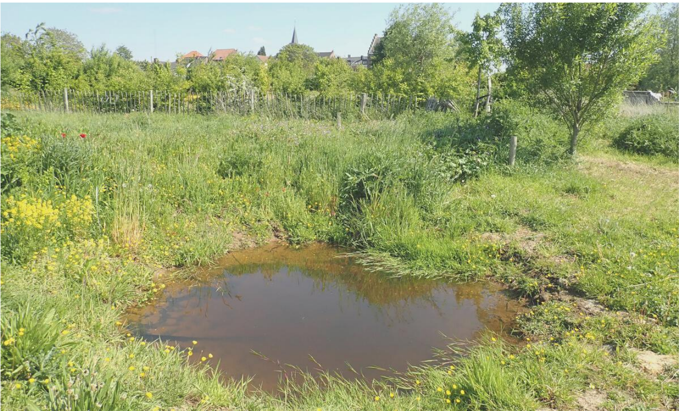
EEN SEIZOEN LATER NA HET UITGRAVEN VAN DE POEL IS DIT HET RESULTAAT!

We passeren de grote serre waar voorlopig wat sla en kolen in groeien maar binnenkort planten we hier de tomaten, paprika's en aubergines uit. We zijn in een grote cirkelbeweging gelopen en komen nu terug uit aan het kalkgrasland. Dat betekent dan onze rondleiding erop zit. Hopelijk heb je er van genoten. Ik in elk geval wel.