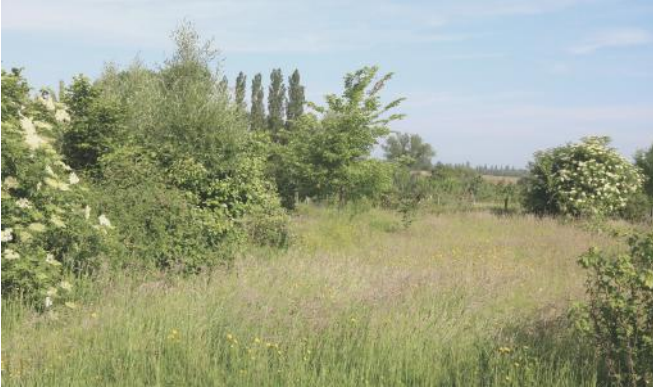
DE OORSPRONKELIJKE TUIN NA TRANSFORMATIE MET STRUIKEN EN LANG GRAS

Een tweede primeur voor onze tuin! Het is wel nog te vroeg om uit te maken over welke orchidee het zou gaan. In elk geval hebben we op hetzelfde moment ook nog op een andere plek in de tuin een gevlekte orchis ontdekt. Dus wie weet, hebben we er in één klap twee zeldzame soorten bij.